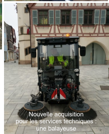
Nouvelle acquisition pour les services techniques : une balayeuse

Dans le cadre du réaménagement du centre-ville, la commune s'est dotée de nouvelles décorations de Noël. 15 guirlandes composées de LED, plus économiques et ayant une durée de vie plus importante, ornent joliment les rues du centre-ville aux couleurs des fêtes. Cet investissement de 16 000 € sera rapidement rentabilisé avec l'abandon des ampoules énergivores.