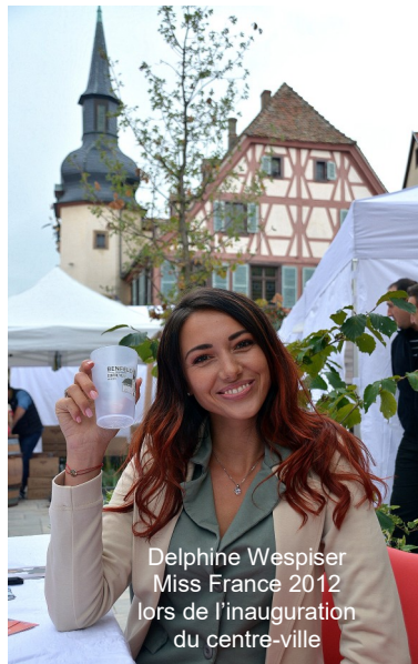
Delphine Wespiser Miss France 2012 lors de l'inauguration du centre-ville