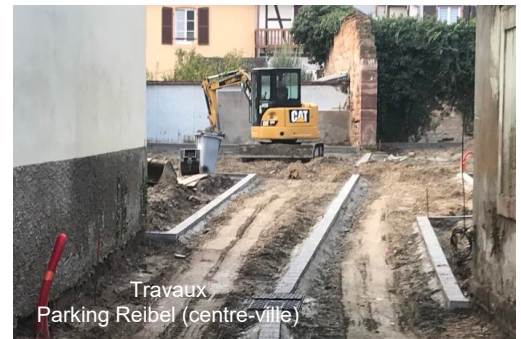
Travaux Parking Reibel (centre-ville)