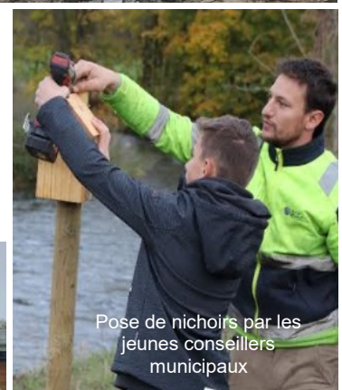
Pose de nichoirs par les jeunes conseillers municipaux