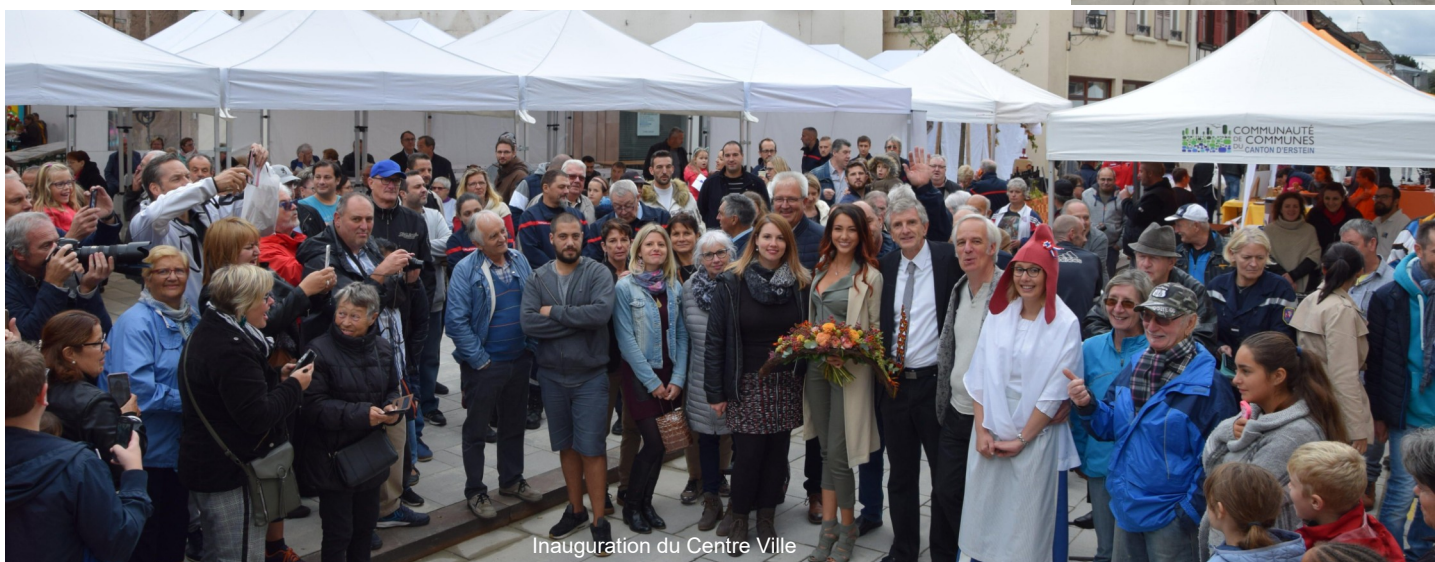
Inauguration du Centre Ville