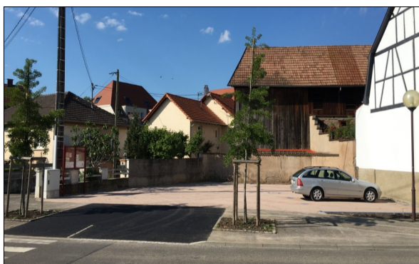
Création parking Souvenir Français (Fbg du Rhin)