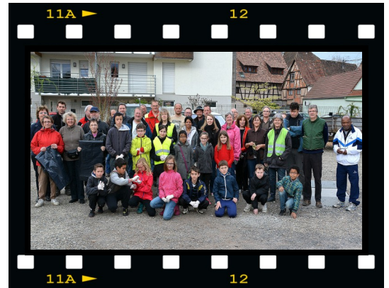
Rendez-vous aux ateliers municipaux le 16 avril pour l'oschterputz