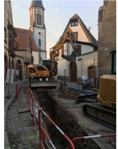
Reprise des travaux rues de l'Eglise, du Presbytère et du Petit Rempart.