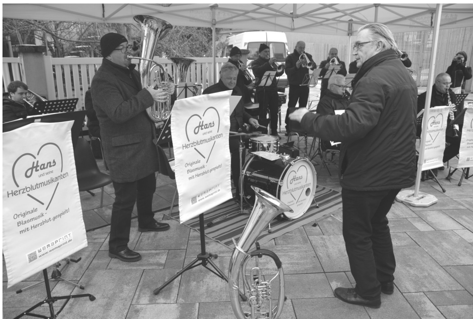
Visite de l'Harmonie d'Ettenheim en janvier dernier