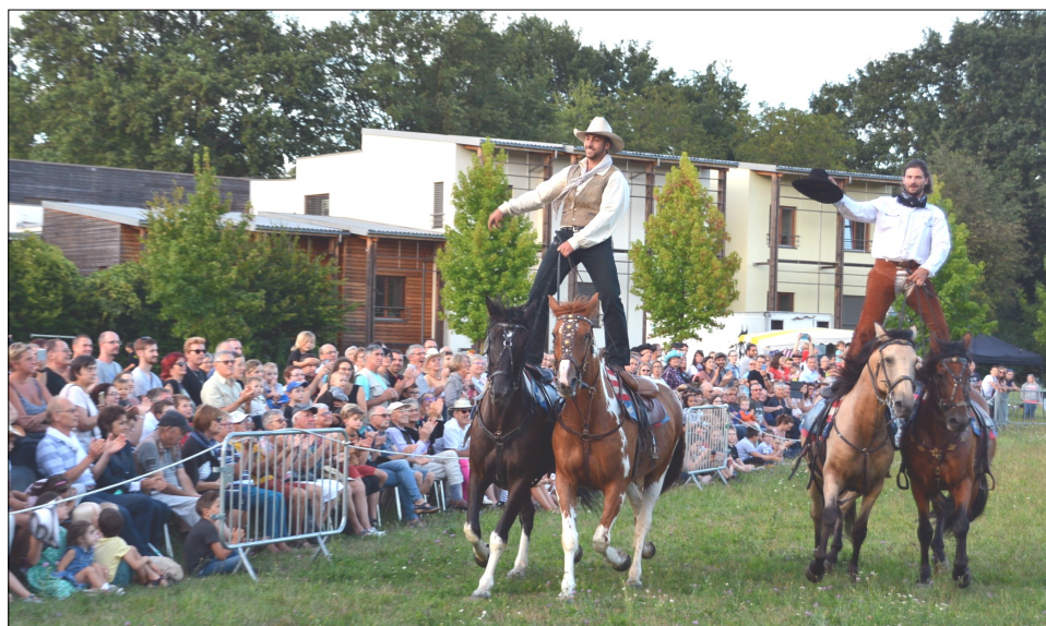
Fête du Stubbehansel 2019