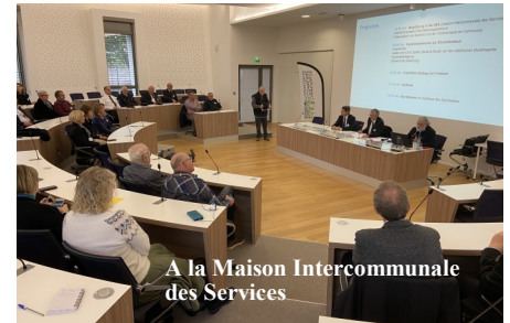
A la Maison Intercommunale des Services