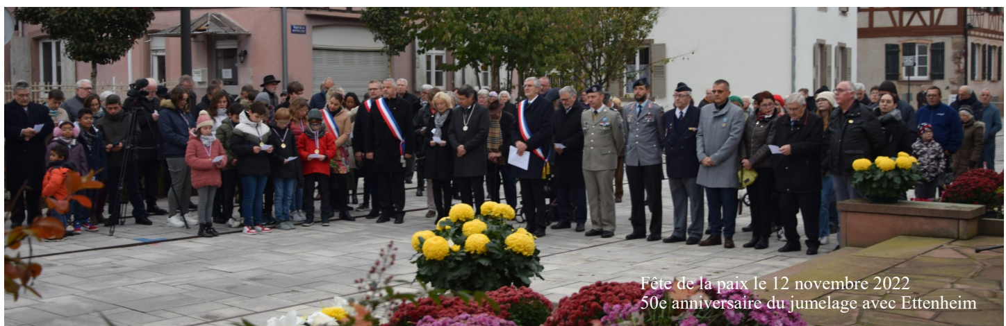
Fête de la paix le 12 novembre 2022 50e anniversaire du jumelage avec Ettenheim