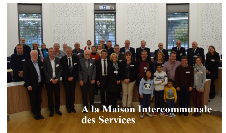
A la Maison Intercommunale des Services