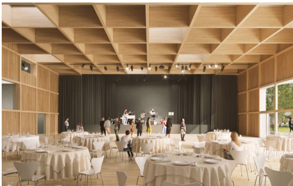
Vues du projet : Cabinet Dominique COULON et Associés. Images non contractuelles

Directeur de la publication : Jacky Wolfarth, Maire. Réalisation : service communication Ville de Benfeld. Périodicité : trimestrielle. Limite de dépôt des articles : le 10 du mois qui précède les éditions, mars, juin, septembre et décembre. Coordination : Bruno Lefebvre. Textes : Jean-Jacques Knopf, Claude Weil, Bruno Lefebvre et Jacky Wolfarth. Photos : Bruno Lefebvre, Jacky Wolfarth, Cabinet Coulon. Tirage à 2800 exemplaires. La mairie est ouverte au public du lundi au vendredi de 9 h à 11 h30 et de 15 h à 18 h. 3 rue du Château 67230 Benfeld Tél. : 03.88.74.42.17 mairie@ville-de-benfeld.fr - www.benfeld.fr