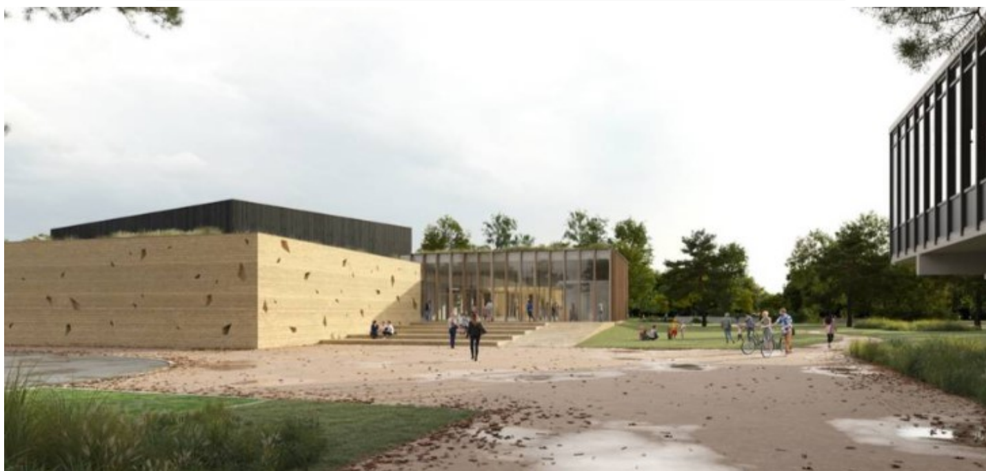
Vues du projet : Cabinet Dominique COULON et Associés. Images non contractuelles